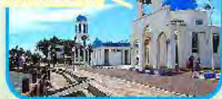
新竹騎跡 集合基地